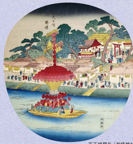
天王崎祭礼(洲崎神社)(名古屋名所団扇絵)

享和2年(1802)9月、9代藩主宗睦の養子であった治行の夫人聖聡院が御座舟を仕立て、31隻の船隊で堀川を下る豪華な舟遊びを行いました。聖聡院はこの舟遊びがよほど気に入ったのか、翌月にも行ったとの記録が残っています。一方、庶民は「月見船」や春の「花見舟」で、堀川の自然を自由気ままに楽しんでいました。