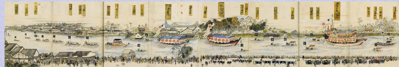
御船御行列之図(納屋橋~照通寺)(名古屋市博物館編「猿蓑庵の本」より)