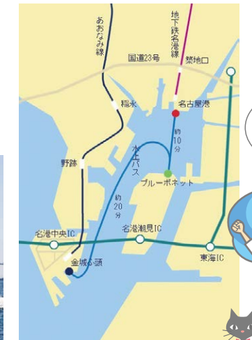
水上バス運航航路