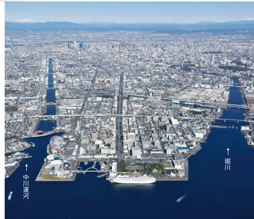
ガーデンふ頭全景