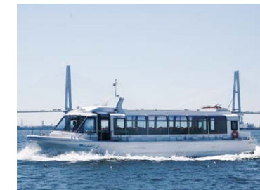
水上バス

土日・祝日の運航ですが、ガーデンふ頭から名古屋港を突っ切って、対岸のワイルドフラワーガーデン「ブルーボネット」に行く水上バスをご存知ですか?ここからさらに、「リニア・鉄道館」や「ポートメッセなごや」のある金城ふ頭に行くこともできます。また、名古屋駅近くの「ささしまライブ24」から中川運河を下って、来秋に開業予定の大型商業施設「ららぽーと」(港区港南)を経て、ガーデンふ頭にいたる水上バス・プランも検討中とか。金城ふ頭には「レゴランド・ジャパン」も開業したことから、新しい水上バス計画は、かなり現実味を帯びた夢いっぱいプランと言えるでしょう。