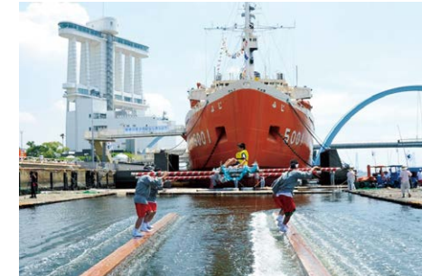
海の名古屋みなと祭(花師一本乗り)