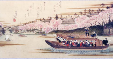
堀川観桜船圖(名古屋城振興協会所蔵)