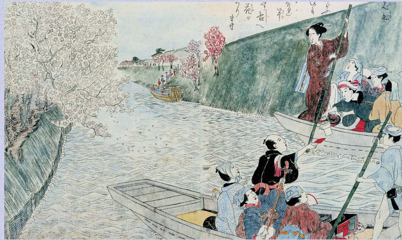
花見船(桜見と春之日圖)(名古屋市博物館編「猿蓑庵の本」より)