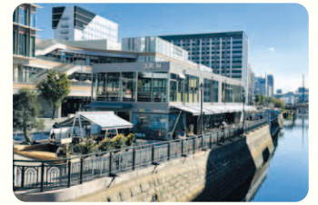
テラス席もあり、運が良ければ堀川を進むゴンドラが見られるかも!?

2023年10月に誕生した、食とエンタメの複合施設。サテライトスタジオや最大100人収容できる多目的イベントスペースをはじめ、地中海料理やラーメン、寿司、スイーツなど多彩な飲食店が揃う。