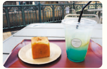
CROCE&Co.NEXTの「青空クラフトレモネード、ころでニ」。