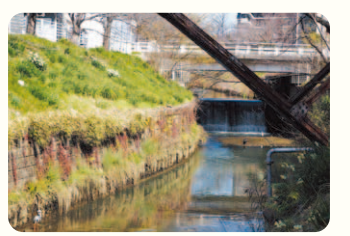
落差工より下流は水面まで遠くなり、景観がガラリと変わる。

猿投橋の下にある、高さ3mほどの滝のようなものが「落差工」。堀川は、河口からこの落差高までが潮の干満の影響を受ける感潮区間。