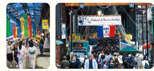
毎年7月に七夕まつり、11月に秋の祭り開催。

名古屋で最も古い商店街と言われる「円頓寺商店街」。懐かしさと新しさが融合した独特の雰囲気が魅力。近くの「四間道」の町並みも見!