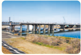
手前が庄内用水頭首工、奥が水分橋。左側に見えるオレンジ色のものは、漂流するごみ避けける「オイルフェンス」。

橋の横のダムに似たものが「庄内用水頭首工」。庄内用水や堀川の取水のために川を堰き止めて水位を上げている。名古屋市で頭首工が見られるのはここだけ!