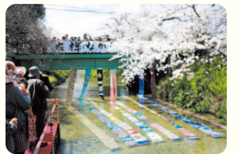
黒川辻栄橋付近では、毎年春に黒川水祥流しを開催。