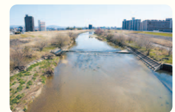
伏越は長さ97間(約176.5m)・幅9尺(2.7m)・高さ3尺(0.9m)。