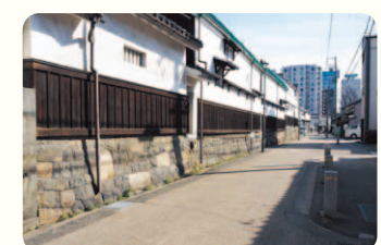
石垣の上に建つ土蔵群と軒を連ねる町家が見られる「四間道」。