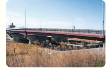
矢田川にかかる三階橋。伏越はすぐ上流に。

矢田川と堀川が立体交差する場所。川が地下に潜って立体交差することを「伏越(ふせこし)」と言い、庄内川から取水した水が矢田川の下をトンネルを流れている。