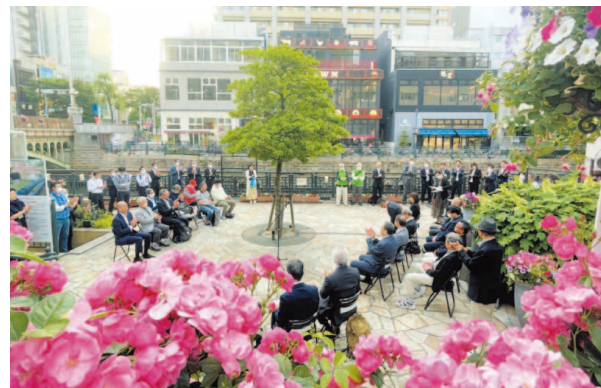
第2回堀川検定アンバサダー任命式の様子