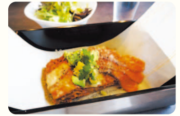
和風ラザニア専門店Yの「和風ラザニア(サーモン&アボカド)」