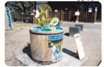
金鯱水は、金シャチ横丁に2台あるにや。