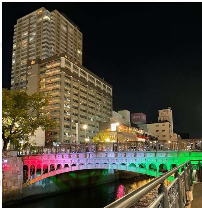
クリスマス期間の納屋橋